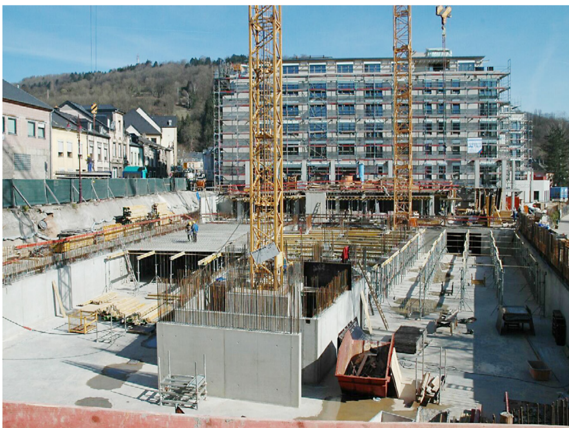
Dat neit Altersheem wiisst lues awer sécher rop

JD: Je tiens à remercier toutes celles et tous ceux qui par leur aide directe ou indirecte ont contribué à faire rayonner Diekirch en 2010.